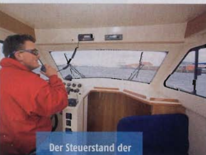
Der Steuerstand der R 870 bietet alles, was ein Arbeitsboot ausmacht

Auch die in regelmäßigen Abständen durchzuführenden Routinekontrollen an der Maschine, dem 160 Liter fassenden PVC-Wassertank und dem 455-Liter-Spritreservoir geraten dank des guten Platzangebots zum Kinderspiel. Das 3,05 Meter breite und etwas mehr als fünf Tonnen verdrängen-